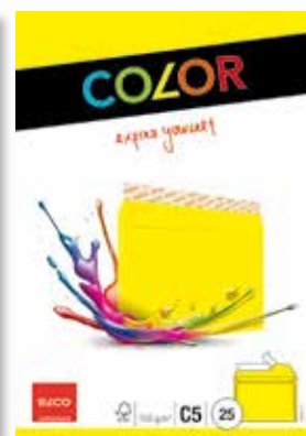
Für eine verkaufsfördernde Präsentation am PoS: Die Verpackungen der vier Hauptproduktlinien im neuen Look